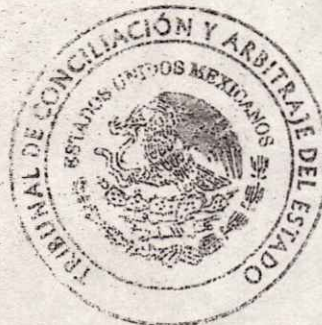
Audiel Sadluis Rivera Auxiliar Contable del Tribunal de Conciliación y Arbitraje del Estado de Tlaxcala